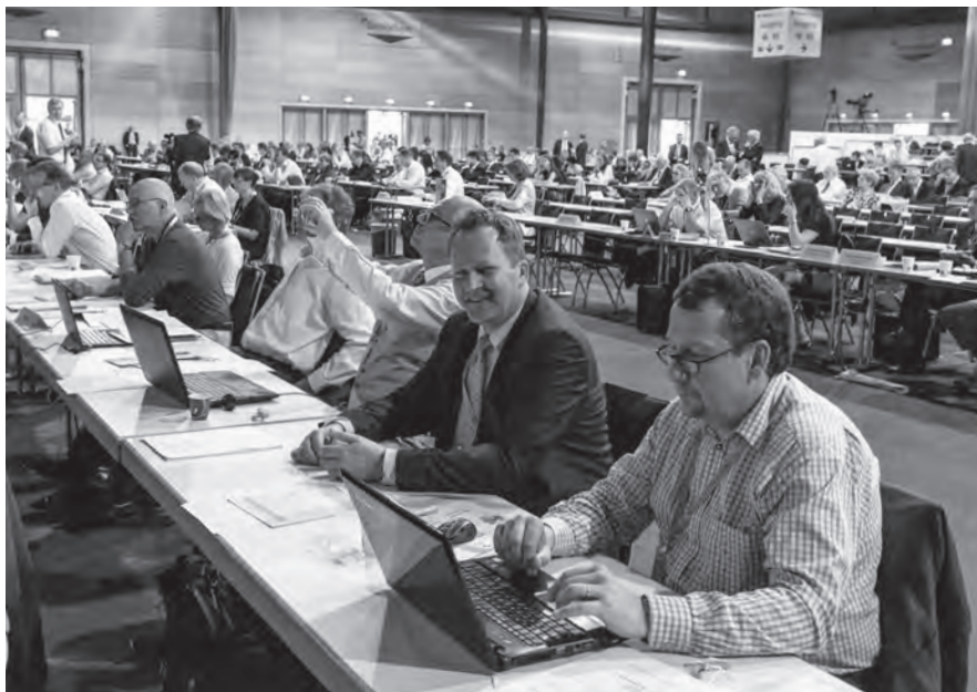
Berliner Delegierte bei der Arbeit.

Der Haushalt für das kommende Jahr musste auch noch verabschiedet werden. Große Diskussionen blieben in diesem Jahr aus. Für Unmut sorgten bei einigen Delegierten Schäden im Leitungssystem des Gebäudes der Bundesärztekammer am Berliner Tiergarten. Dabei war es vor allem der Umstand, dass diese so spät entdeckt wurden, der für Missfallen sorgte. Ansonsten wurden der BÄK-Vorstand entlastet, der Jahresabschluss genehmigt und der Haushaltsplan verabschiedet – alles einstimmig.