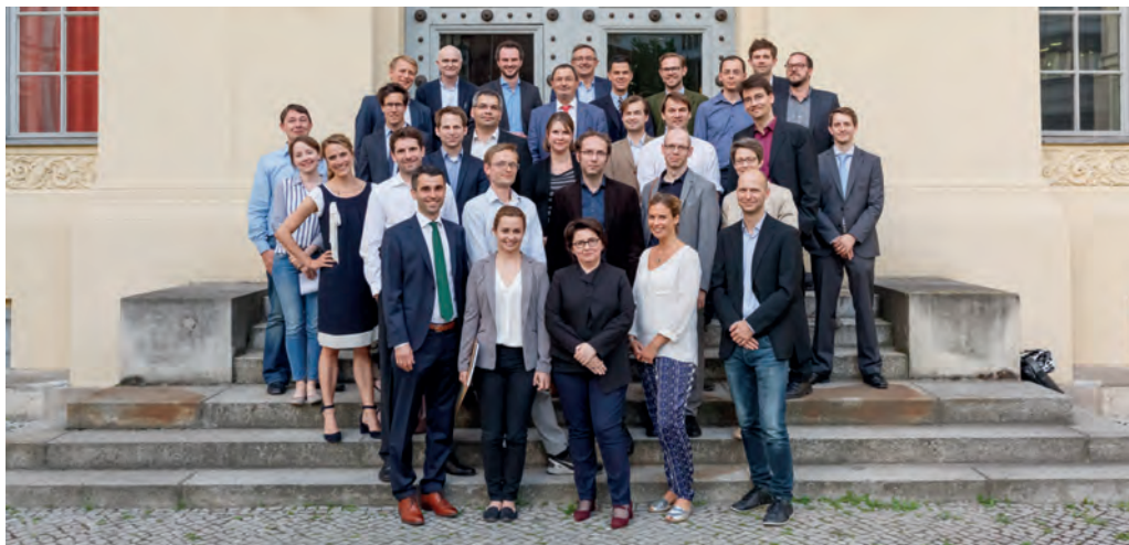
Die Absolventen des Programms und die Gastredner der Festveranstaltung.