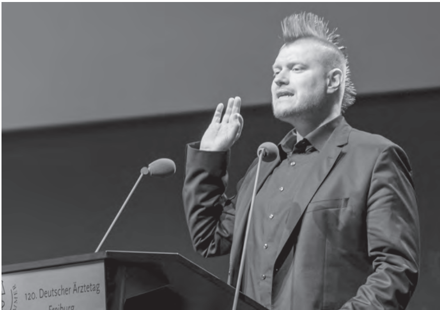
Sascha Lobo nahm die Ärzteschaft beim Thema Digitalisierung in die Pflicht.

Auch beim Thema Fernbehandlungen gab es eine offene Diskussion. Anders als oftmals vermutet, ist die Fernbehandlung keinesfalls durch das ärztliche Berufsrecht generell verboten. Vielmehr ist ein sehr weites Spektrum telemedizinischer Versorgung von Bestandspatienten mit der ärztlichen Berufsordnung vereinbar. Die Delegierten begrüßten die Durchführung von Modellprojekten zur Fernbehandlung und forderten die BÄK auf zu prüfen, ob die (Muster-)Berufsordnung für Ärzte um einen Zusatz ergänzt werden kann, nach dem die Ärztekammern in besonderen Einzelfällen Ausnahmen für definierte Projekte mit wissenschaftlicher Evaluation zulassen können. Dabei müsse aber sichergestellt sein, dass berufsrechtliche Belange nicht beeinträchtigt werden.